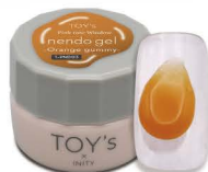
T-PND03 Orange gummy