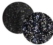
オクタゴン T-PF17 [140240] 煌びやかなアメーzingブラックに フラッシュパウダーをミックス