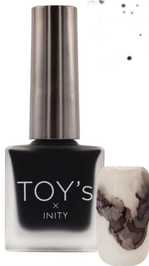
T-BAI02 ブラウンブラック