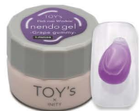
T-PND09 Grape gummy