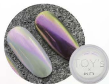
ビビッドピンク T-NA07 [118875]