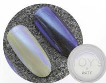
スカイブルー T-NA08 [118876]