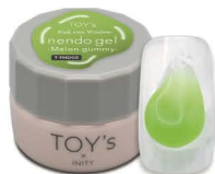
T-PND05 Melon gummy