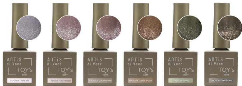
パールアイリス T-ADV01 [137815]