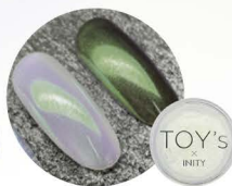
グリーン T-NA05 [115815]