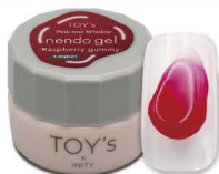
T-PND01 Raspberry gummy