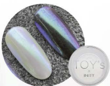
ライムグリーン T-NA09 [118877]