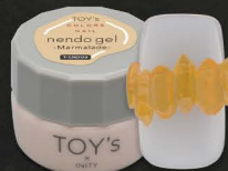
T-CND09 Marmalade [126040]