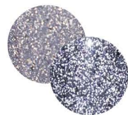
トゥモローランド

T-PF03 [129458] 優しいグリーンに オーロラクラッシュホロが入った フラッシュラメ