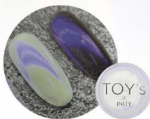
ブルー T-NA04 [115814]