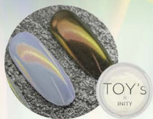
オレンジ T-NA01 [115811]