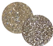
キャメロット T-PF14 [140237] ラグジュアリーな 大人シャンパンベージュに フラッシュパウダーをミックス