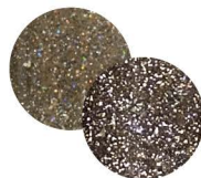
ズーク T-PF15 [140238] だれかも愛される フレッシュブラウンに フラッシュパウダーをミックス