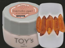
T-CND10 cinnamon [128927]