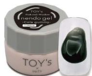
T-PND10 Cola Gummy