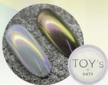
ピンク T-NA02 [115812]