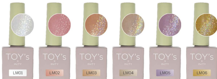
ホワイトグレーモカ T-LM01 [128904]