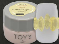
T-CND08 Honey [126039]