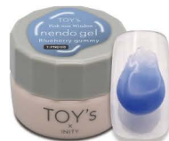
T-PND08 Blueberry gummy