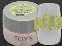
T-CND07 Green Tea [126038]