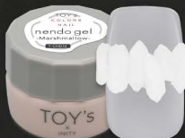
T-CND12 Marshmallow [128929]