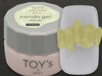
T-CND06 Olive [126037]