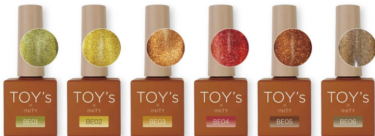
ウリ T-BE01 [135818]