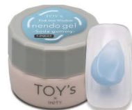
T-PND07 Soda gummy