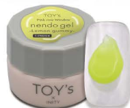
T-PND04 Lemon gummy