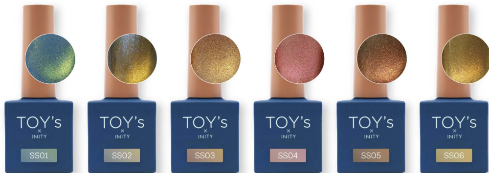
ブルームーン T-SS01 [140150]