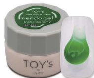
T-PND06 Suica gummy