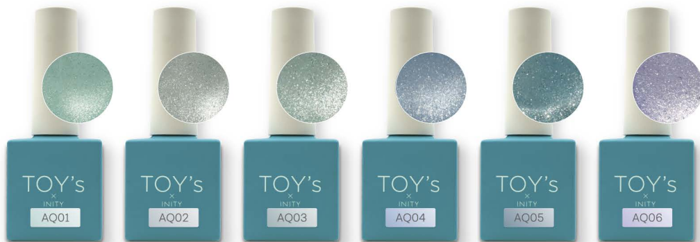
ホライズン T-AQ01 [140514]