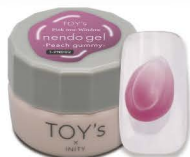
T-PND02 Peach gummy