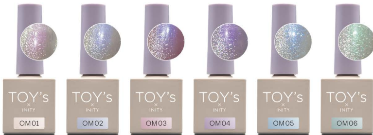
カプリコーン T-OM01 [125962]