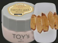
T-CND11 Moca [128928]