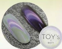
パープル T-NA03 [115813]