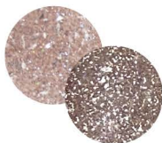
オムニア T-PF13 [140236] くすみがかかったファビュラスピンクに フラッシュパウダーをミックス