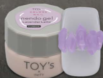
T-CND04 Lavender Latte [126035]