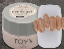
T-CND02 Almond [126033]