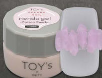
T-CND03 Cotton Candy [126034]