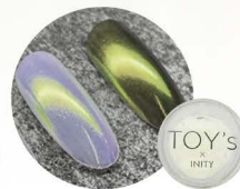
イエロー T-NA06 [115816]