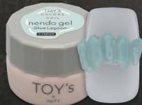
T-CND05 Blue Lagoon [126036]