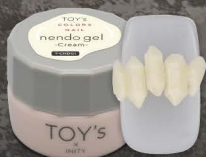
T-CND01 Cream [126032]