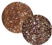
アトム T-PF16 [140239] ヘブンリーなオレンジブラウンに フラッシュパウダーをミックス